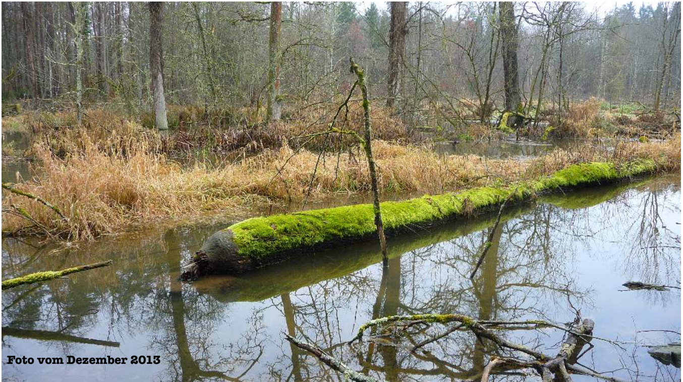
Foto vom Dezember 2013

Anschliessend wandern wir weitere rund 8 km zum Naturzentrum Thurauen resp. zur Bushaltestelle. Unterwegs essen wir einen z'Mittag. Wieviel Kraft noch für Ausstellung oder Restaurant bleibt, wird sich zeigen.